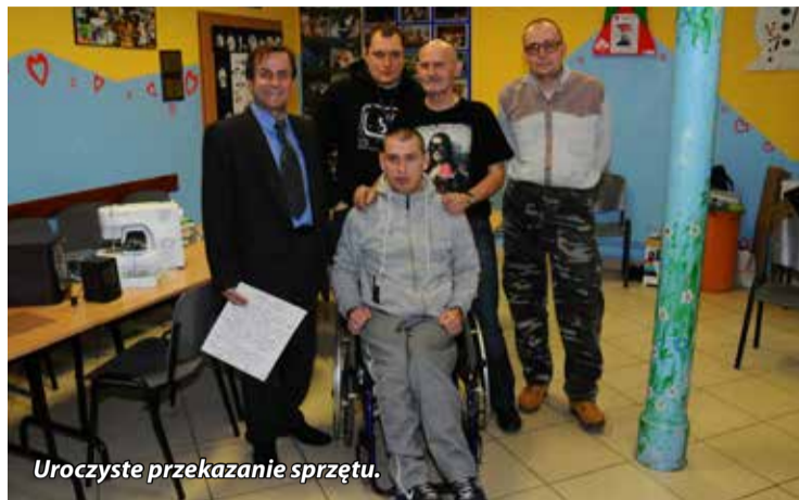
Uroczyste przekazanie sprzętu.

nialemu gestowi, będą miały możliwość poszerzenia umiejętności, zainteresowań oraz zwiększania własnej skuteczności w codziennym życiu. Za to Wszyscy serdecznie dziękujemy!