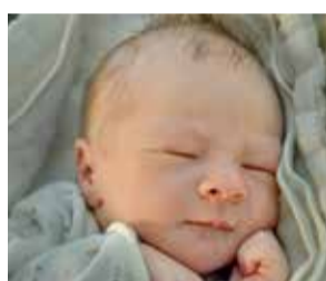
Ignas Rybak 20 grudnia 2015